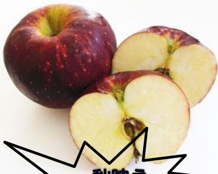
秋映え しなのスイート